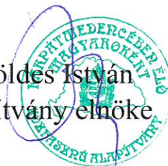
Földes István Alapítvány elnöke